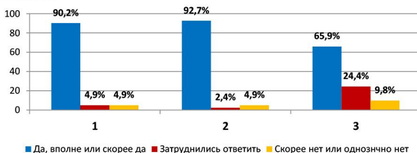
Рис. 2. Оценка некоторых аспектов образовательной деятельности учреждения

Из рисунка 1 видно, что преобладающее большинство участников анкетирования (82,5%) оценивают работников учреждения как доброжелательных и вежливых. Негативно оценивают уровень доброжелательности и вежливости 7,5% опрошенных, а 10% затруднились ответить.