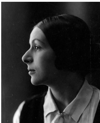
Вера Сергеевна Костровицкая. 1930-е годы.

Отдел рукописей РНБ. Ф. 1274 (В. С. Костровицкая). № 8