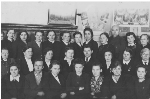
Педагогический коллектив 402 средней школы, 1949 г.