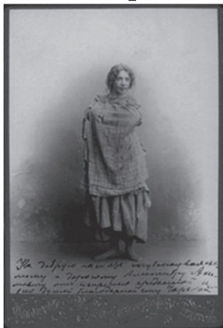
Л. А. Чарская. Альбом Саннина (Театральный музей им. А. А. Бахрушина. ФДД. 44846)

Лидия Алексеевна Чарская, урожденная Воронова, родилась 19 января по старому и 31 января по новому стилю 1875 года в Петербурге [22].