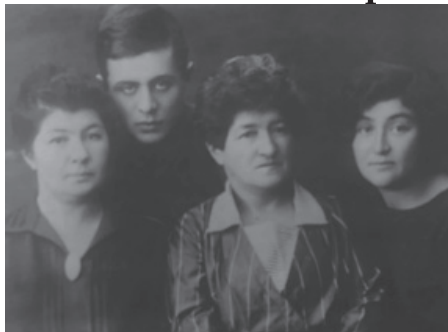
Фотография Геннадия Гора с писательницами

Думаю, каждый юный читатель когда-нибудь листал страницы научно-фантастических книг, желая заглянуть в будущее. Я не исключение. Ещё в детстве я осознала, что фантастические истории привлекают меня своей неповторимостью и, казалось бы, невозможностью. Однако, это не всегда так. Очень часто научная фантастика превращается в реальность. Наверное, потому это мой любимый жанр.