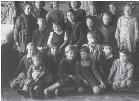
Фотография воспитанников лагеря Литфонда в селе Чёрная Пермского края.

В сентябре 2019 года я стала участницей межрегионального исследовательского проекта «Спасённое детство», основная задача которого – изучение эвакуации ленинградских учреждений в годы Великой Отечественной войны. Сферой моих интересов стало исследование истории эвакуации лагеря Ленинградского Литературного фонда 1 : я изучала этапы, списки детей и педагогов. Когда подробности эвакуации были исследованы, я решила посвятить несколько глав своей работы сотрудникам лагеря Литфонда, благодаря которым дети ленинградских писателей остались живы в годы войны. За два с половиной года работы мне удалось найти информацию об 11 сотрудниках лагеря Литфонда. Поскольку исследование о нескольких педагогах уже было представлено в