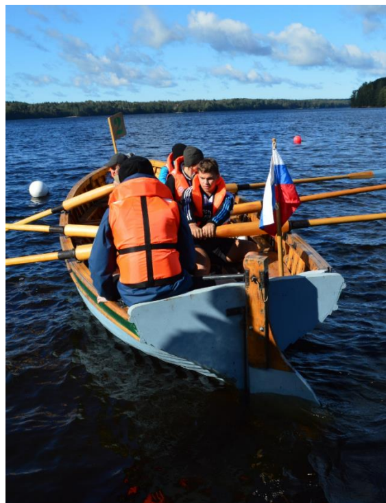
Фотографии с соревнований, 2021 г.