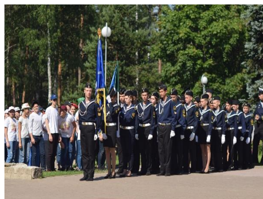
Фотографии с мероприятия, 2018 г.