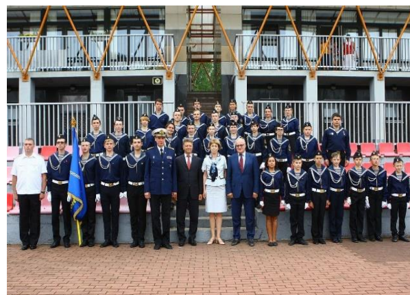
Фотографии с мероприятия, ЗЦДЮТ «Зеркальный», 2017 г.