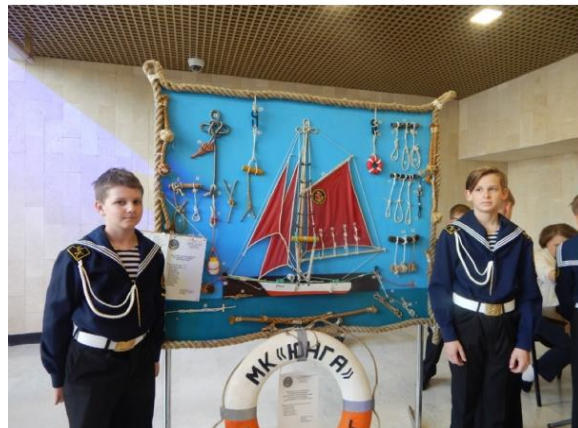
Фотографии мероприятия 2017г., 2018 г.