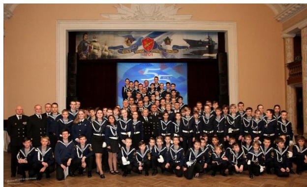
11.03.2017 г. – 55-летия Морского Клуба "Юнга" в военно-морском институте ВУНЦ ВМФ «Военно-морская академия им. Н.Г. Кузнецова».