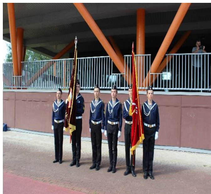
Фотографии с церемонии открытия, 2019 г.