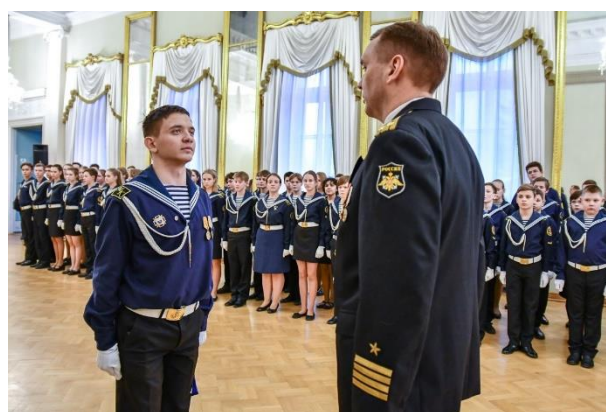
19.02.2020 г. – 58-летие Морского Клуба "Юнга" в Аничковом дворце.