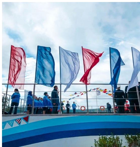
Фотографии с мероприятия, 2018 г.