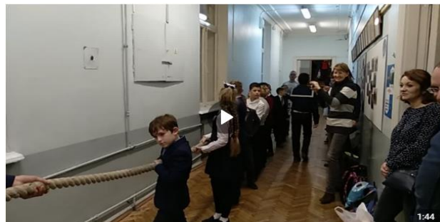
ОСЕННИЙ ШКВАЛ-2018. Перетягивание каната. Первокурсники. 175 просмотров