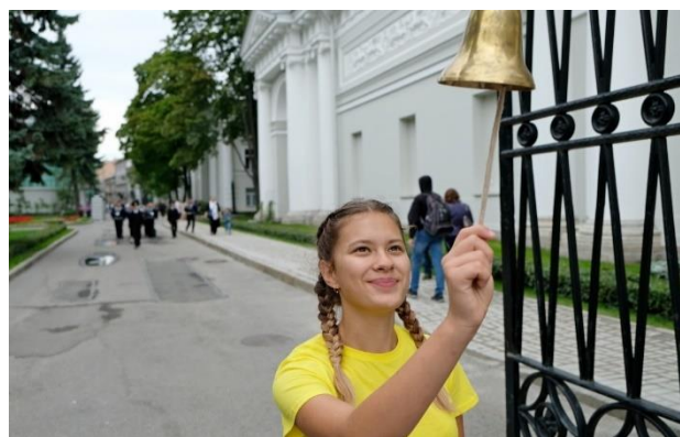
Фотографии с городского праздника "ПОД ПАРУСОМ ДЕТСТВА", 2018 г.