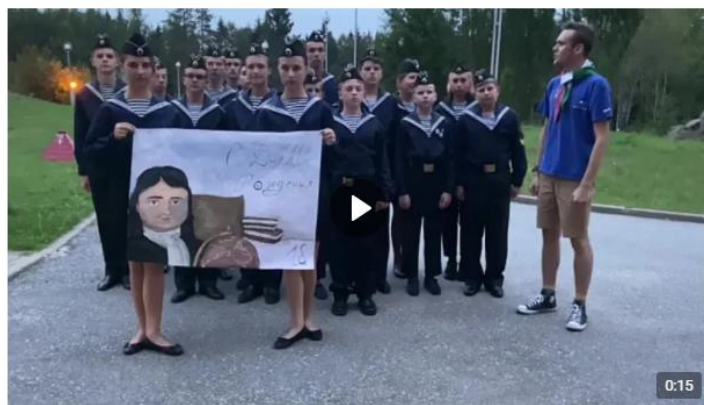
Видео от Морской Клуб "Юнга" Санкт-Петербург 172 просмотра