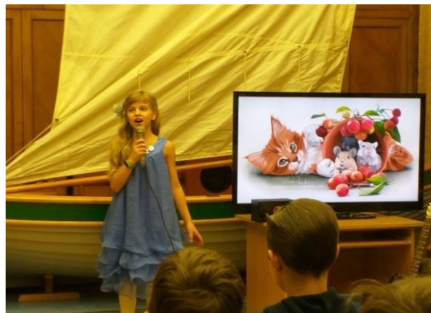
Фотографии с мероприятия, 2019 г.

ДИСТАНЦИОННОЙ ПРОГРАММЫ КЛУБА "ЗИМНЯЯ СКАЗКА-2021" ПО МЕРЕ ПРОСМОТРА МАТЕРИАЛОВ ПОПРОБУЙТЕ ОТВЕТИТЬ НА ОДИН ВОПРОС: ЧТО В СКАЗКЕ - САМОЕ ГЛАВНОЕ? ОТЛИЧНОГО ВЕЧЕРА ВСЕМ! МЫ - ВМЕСТЕ!