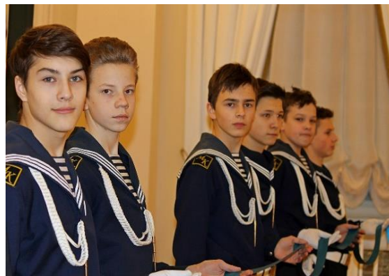
Фотографии с мероприятия, 2017 г.