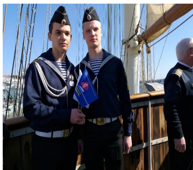
Фотографии с мероприятия, 2019 г.