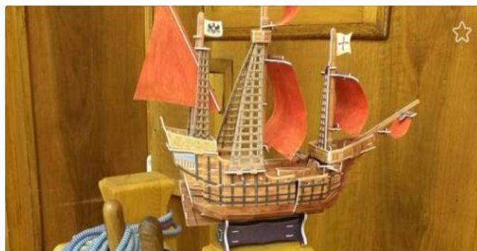
Скриншоты мероприятия при дистанционном формате проведения из официальной учебной группы МК «Юнги» в социальной сети (2020-2021 г.)