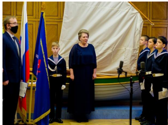
19.02.2021 г. – 59-летие Морского Клуба "Юнга".