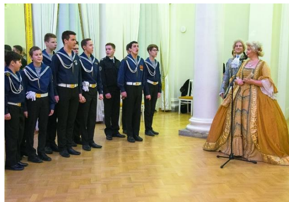
19.02.2018 г. – 56-летие Морского Клуба "Юнга".