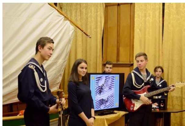
Фотографии мероприятия разных лет (2018 – 2019 г.)