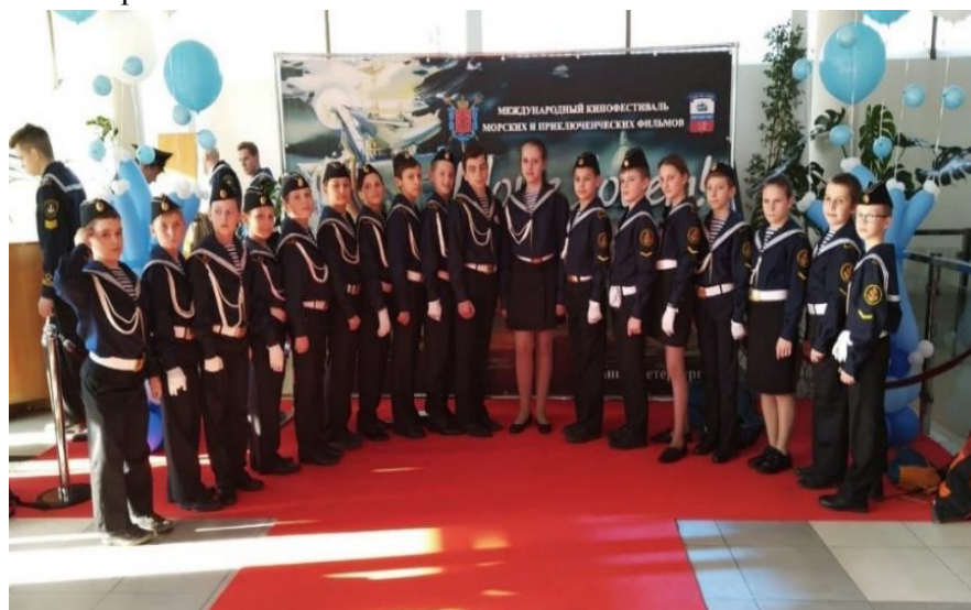
Фотографии с мероприятия, 2019 г.

Юные воспитанники клуба приняли участие в церемонии открытия XVI Международного кинофестиваля "Море зовет".