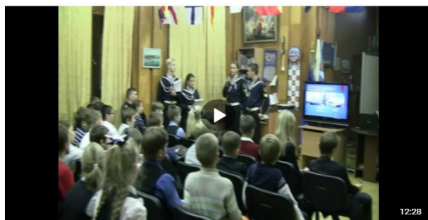
ОСЕННИЙ ШКВАЛ-2018. Знакомство (авг. 225)

насыщенной жизни клуба, участии в событиях, мероприятиях и фестивалях разного уровня. Юнги старших курсов выступают в роли наставников для своих младших коллег.