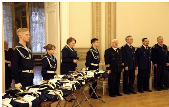
19.02.2019 г. – 57-летие Морского Клуба "Юнга" в парадных залах Аничкова дворца.