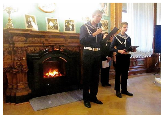
Фотографии с творческой встречи, 2017 г.