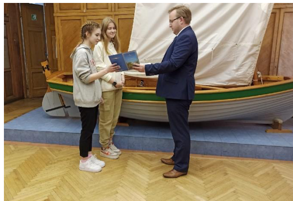
Торжественное вручение учащимся МК «Юнга» сертификата об окончании обучения