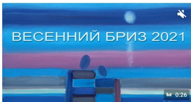
Май 2021 г., «Весенний Бриз», дистанционный формат проведения

И МЫ, ПЕДАГОГИ МОРСКОГО КЛУБА "ЮНГА", ПРИГЛАШАЕМ ВСЕХ УЧАСТНИКОВ НАШЕЙ ГРУППЫ ПРИСОЕДИНИТЬСЯ К ТРАДИЦИОННОМУ СБОРУ "ОСЕННИЙ ШКВАЛ". И ДИСТАНТ НАМ - НЕ ПОМЕХА!