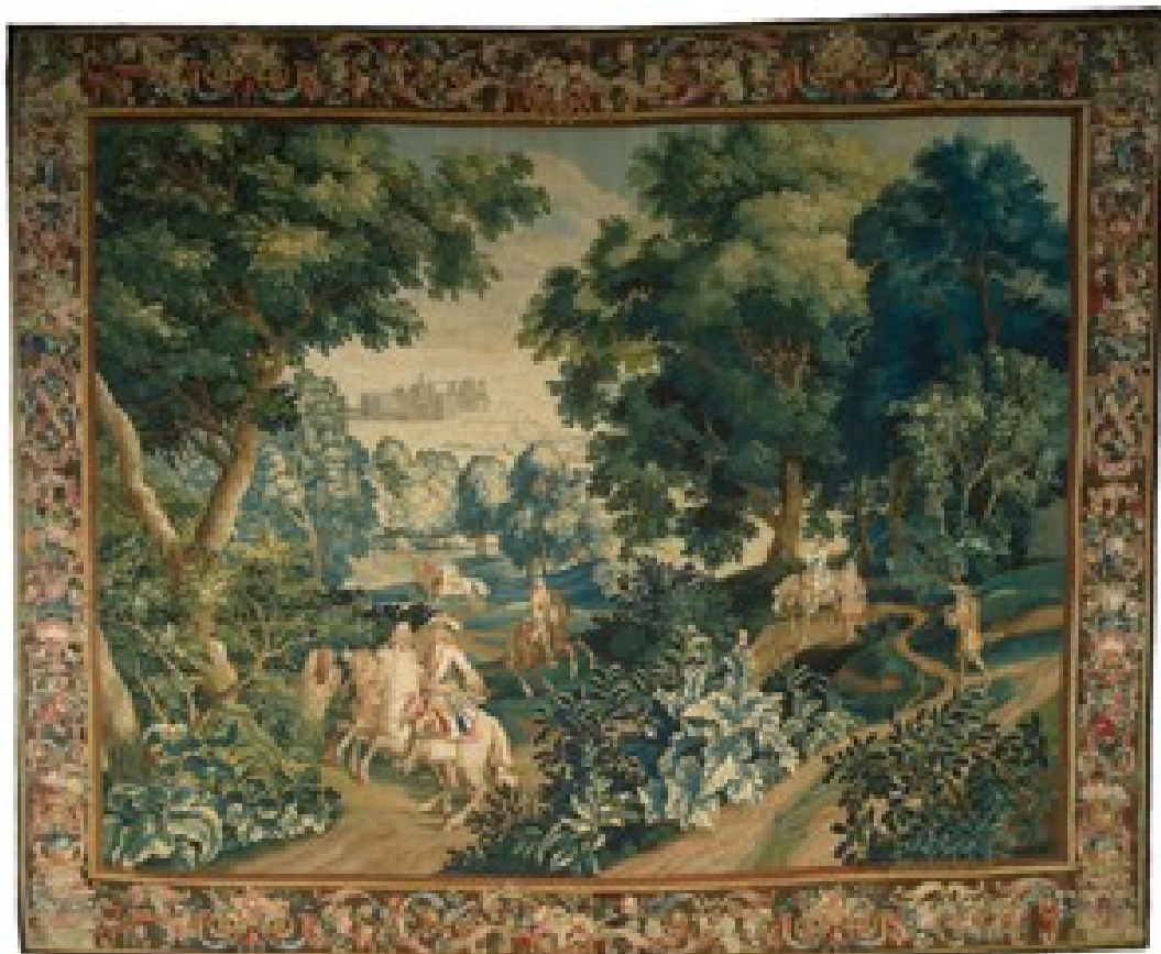
Шпалера «Королевская охота» Франция 1684-1705г. Эрмитаж