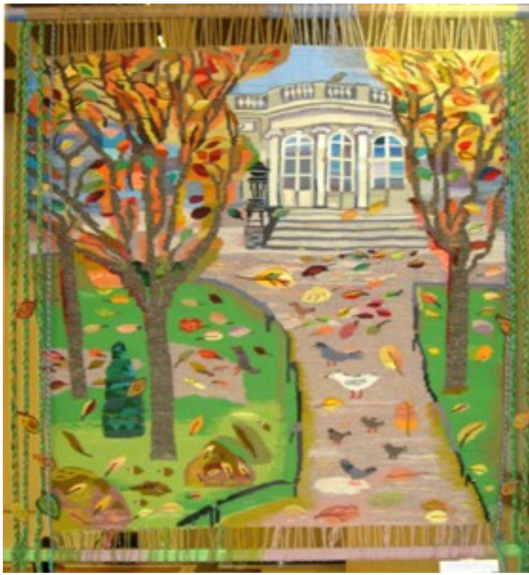
Коллективный гобелен «Павильон Росси в Аничковом саду»