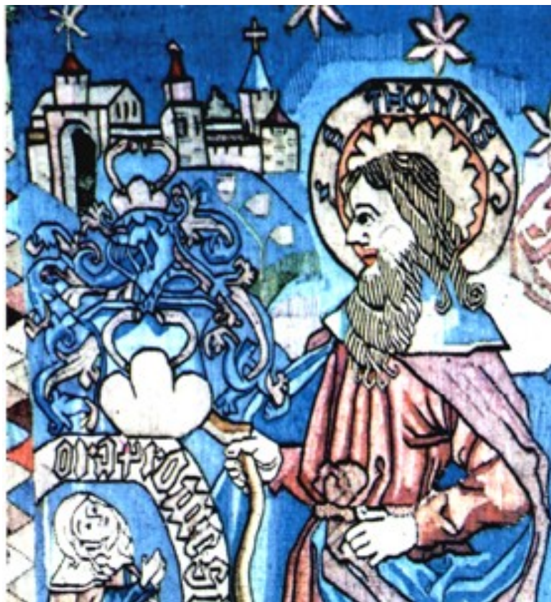
Фрагмент шпалеры «Святые Фома и Матфей» Германия 15в.