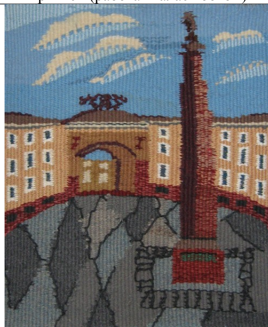
Антонова Ксения 12л. Дворцовая площадь (работа ткалась снизу вверх)