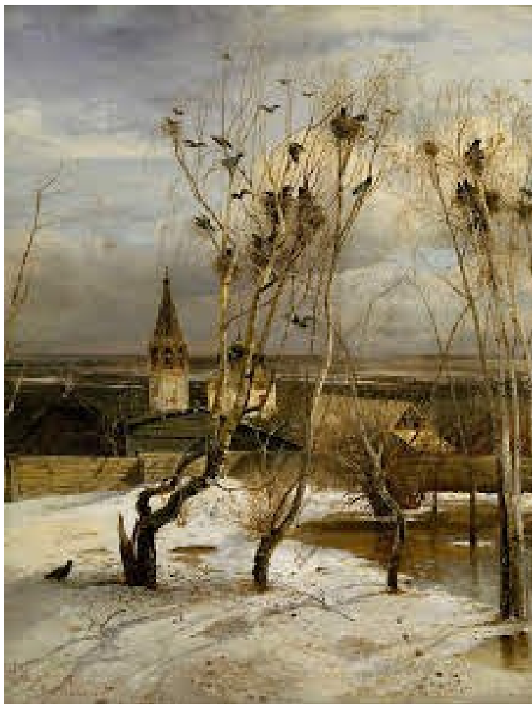
Саврасов А.К. грачи прилетели 1875г.