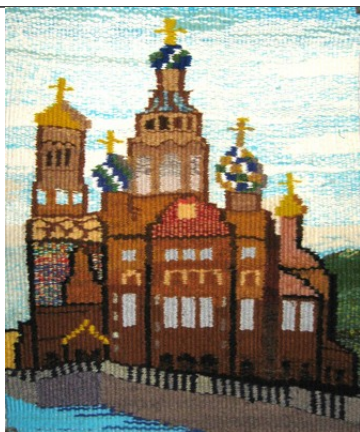
Ларионова Маша 12л. Спас на крови (работа ткалась снизу вверх»)