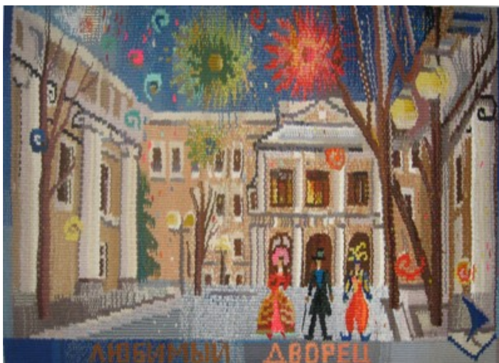
Коллективный гобелен «Любимый дворец» 2007г. (работа ткалась «боком»)