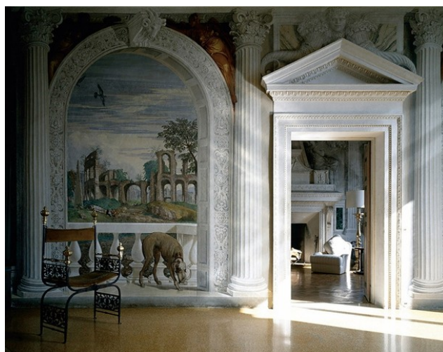
Фрески Паоло Веронезе на вилле Барбаро 1556-67

После художников итальянского Возрождения, рассматриваем альбом о