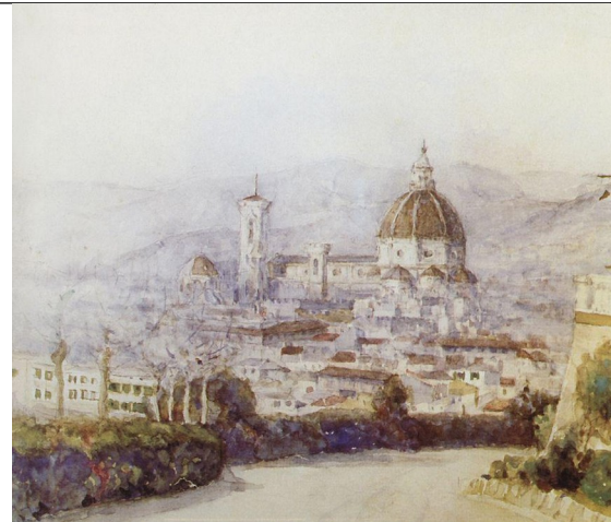
Суриков В.И. Неаполь 1884г.