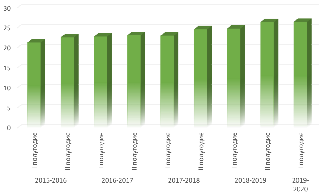
Диаграмма 2. Результаты, подтверждающие наличие положительной динамики освоения ДООП «Программа ансамблевых классов оркестра баянистов»

Личностные результаты , получаемые обучающимися в ходе обучения по Программам, выражаются в повышении у них ответственности, мотивации, дисциплинированности (Диаграмма 3,4).