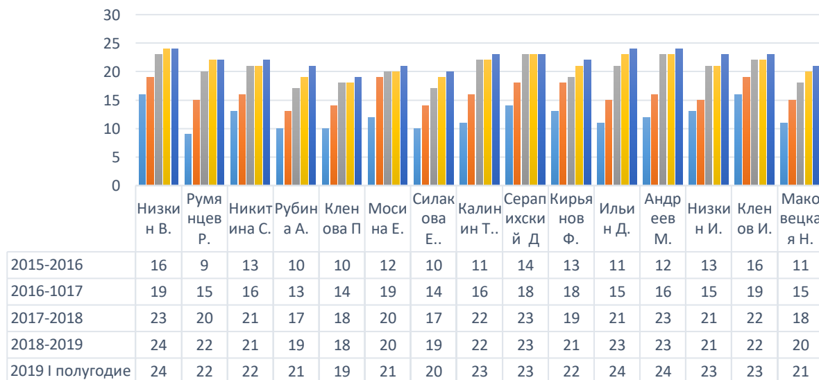
Диаграмма 3. Уровень личностных результатов обучающихся по ДООП «Обучение игре на инструменте (баян, аккордеон) оркестра баянистов»

Личностные результаты , получаемые обучающимися в ходе обучения по Программам, выражаются в повышении у них ответственности, мотивации, дисциплинированности (Диаграмма 3,4).