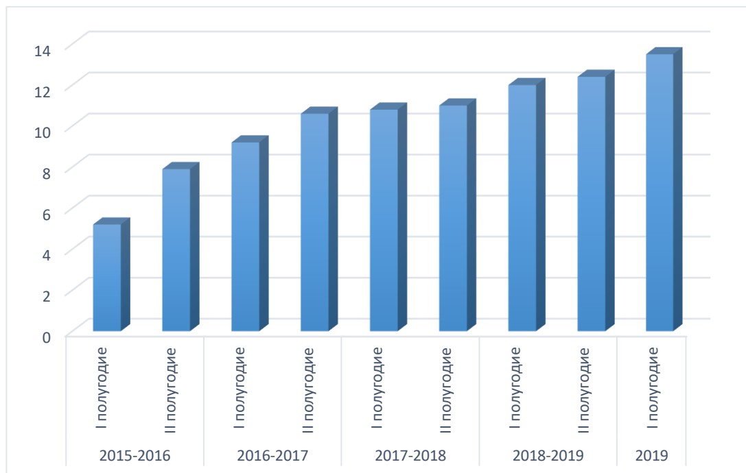
Диаграмма 5. Уровень метапредметных результатов обучающихся по ДООП «Обучение игре на инструменте (баян, аккордеон) оркестра баянистов»

Метапредметные результаты , получаемые обучающимися в ходе обучения по Программам, выражаются в развитии у них коммуникативных компетенций, умении планировать свою деятельность, в проявлении творческих способностей в практическом опыте, умении продуктивно взаимодействовать (Диаграмма 5,6).