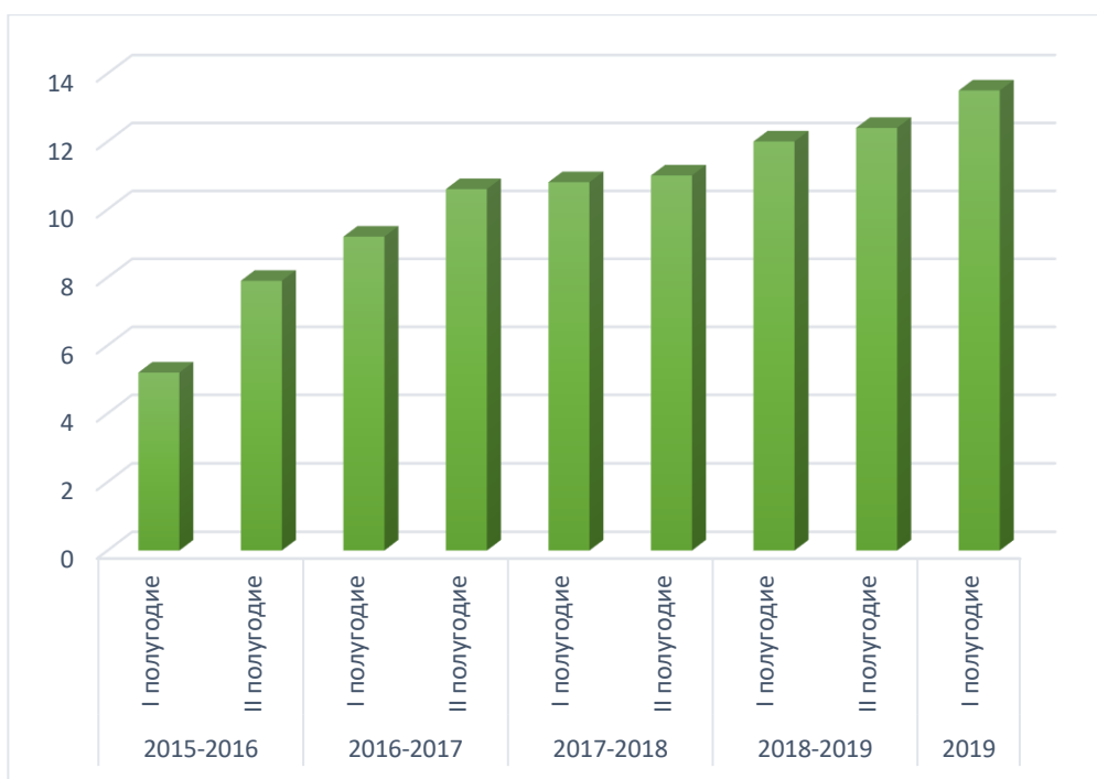
Диаграмма 6. Уровень метапредметных результатов обучающихся по ДООП «Программа ансамблевых классов оркестра баянистов»

В течение обучения метапредметные и личностные результаты при поддержке психологической службы Отдела художественного воспитания ГБНОУ «СПБ ГДТЮ» отслеживаются с помощью методов психолого-педагогической диагностики: наблюдение, анкетирование, анализ вовлеченности учащихся в различные виды деятельности, мотивации учащихся к дальнейшему самосовершенствованию.