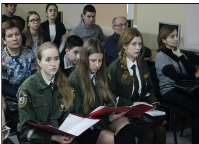
Городской историко-краеведческий конкурс знатоков города «Золотой век архитектуры Петербурга». 2019 год