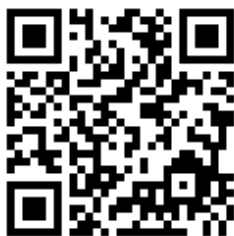
«В начале был ритм»