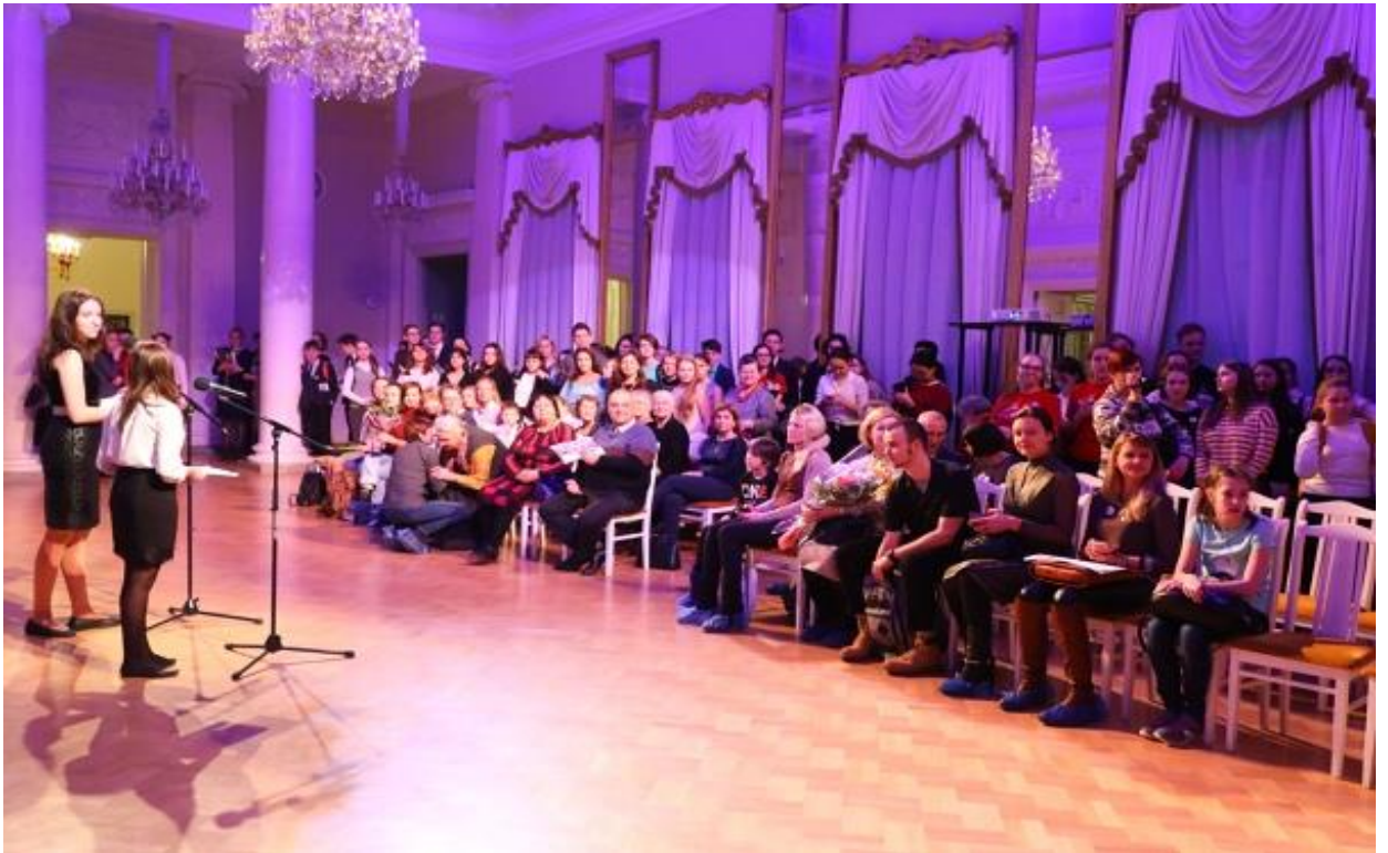
На празднике «День рождения Клуба»