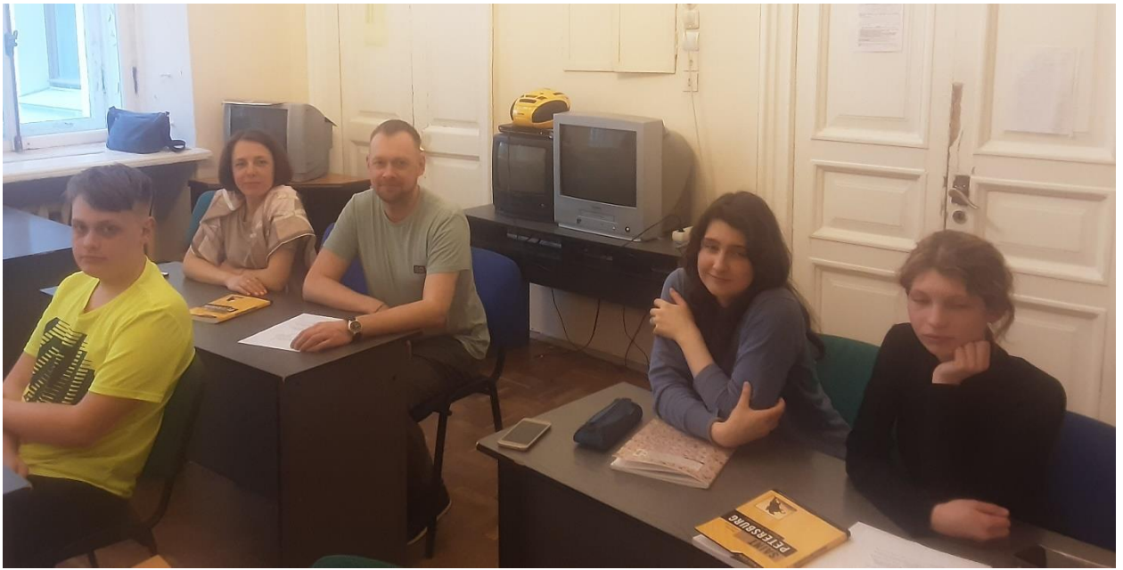
На открытом занятии