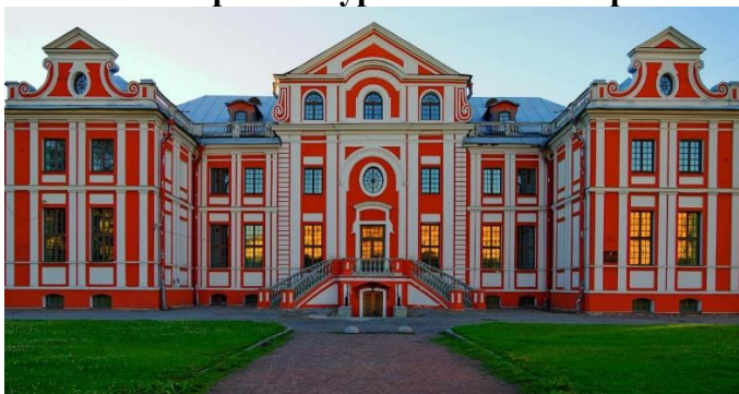
А) Кикины палаты

13. В каком архитектурном стиле построены следующие здания? (Соотнесите буквы и цифры)