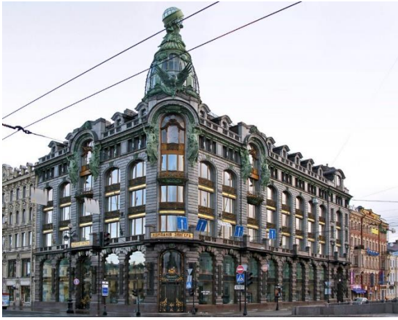
В) Дом компании «Зингер»