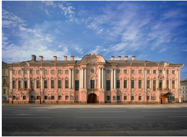
Г) Строгановский дворец