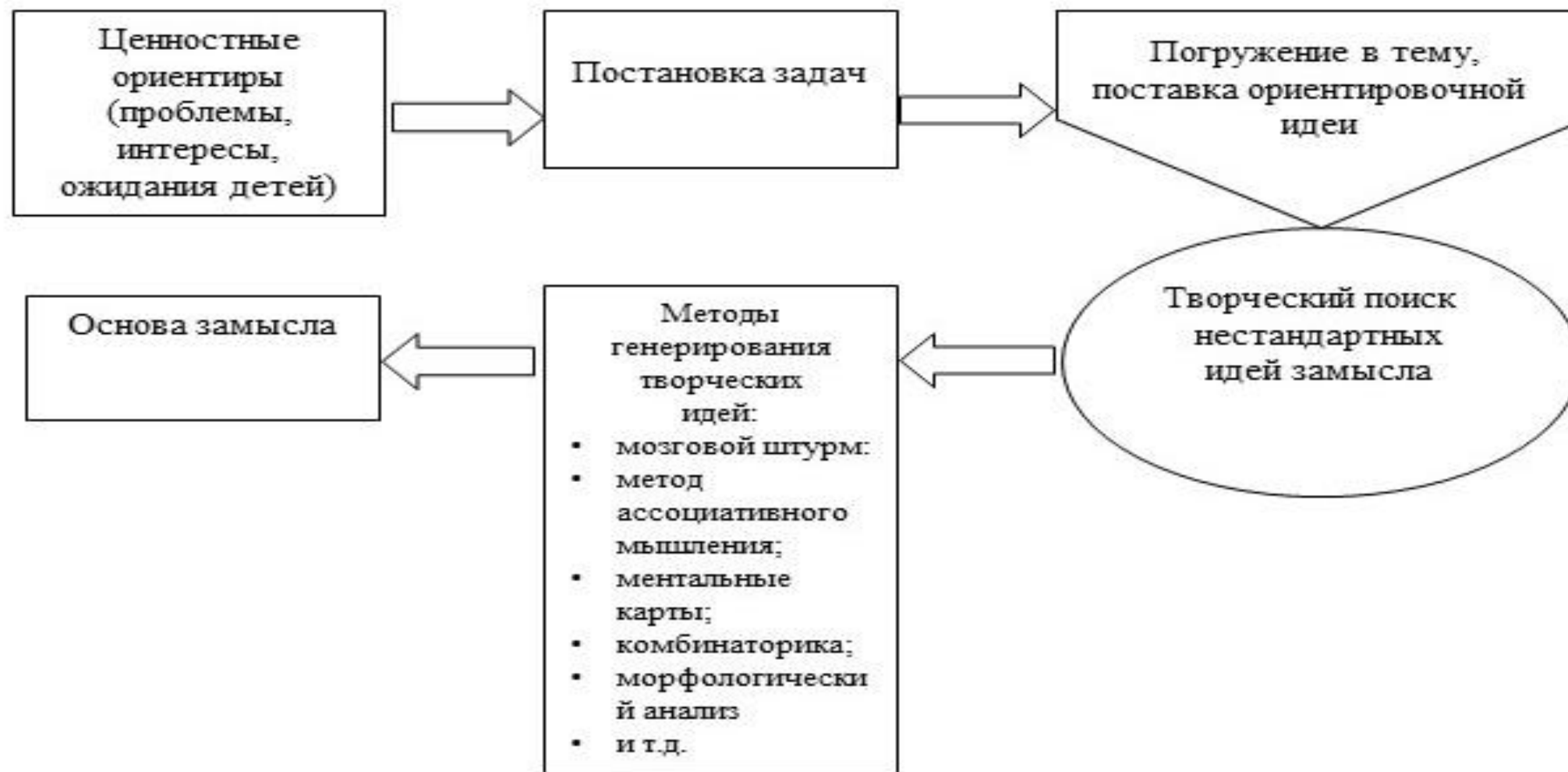
Рис. 8. Схема подхода к разработке новых (нестандартных) идей замысла ИДП

Этот алгоритм позволяет системно подойти к созданию замысла, творческому поиску нестандартных идей