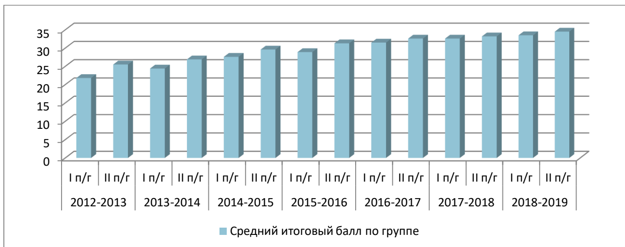
Диаграмма. 1. Результаты, подтверждающие наличие положительной динамики освоения ДООП «Сольфеджио».

По результатам анализа диагностических материалов одной из групп обучающихся по Программе «Сольфеджио» за полный цикл реализации Программы в 2012-2019 г.г. были получены результаты, подтверждающие наличие положительной динамики в уровне освоения Программы и развитии учащихся (Диаграмма 1).